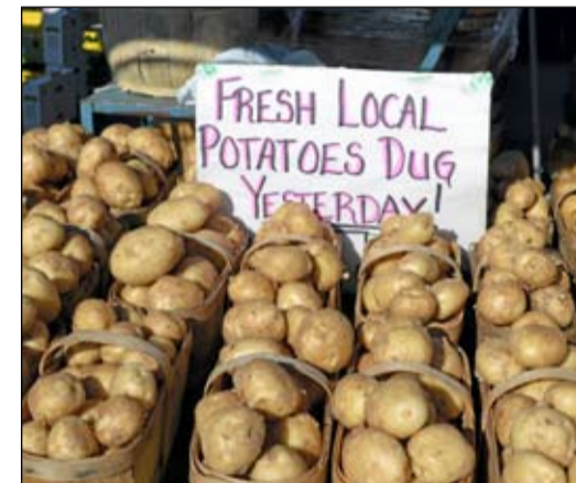
Papuja on tarjolla lähes kaikissa sateenkaaren väreissä. Pikkukoreissa tuoretta perunaa.