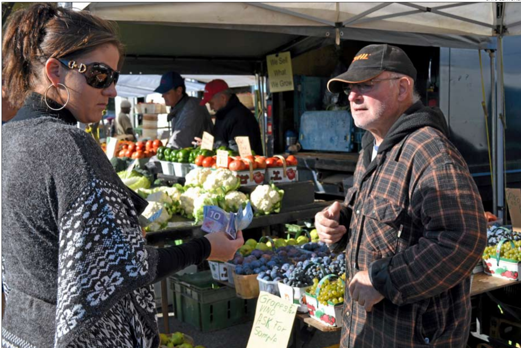
Kauppa käy kiivaasti St Jacobsin tuottajatorilla.