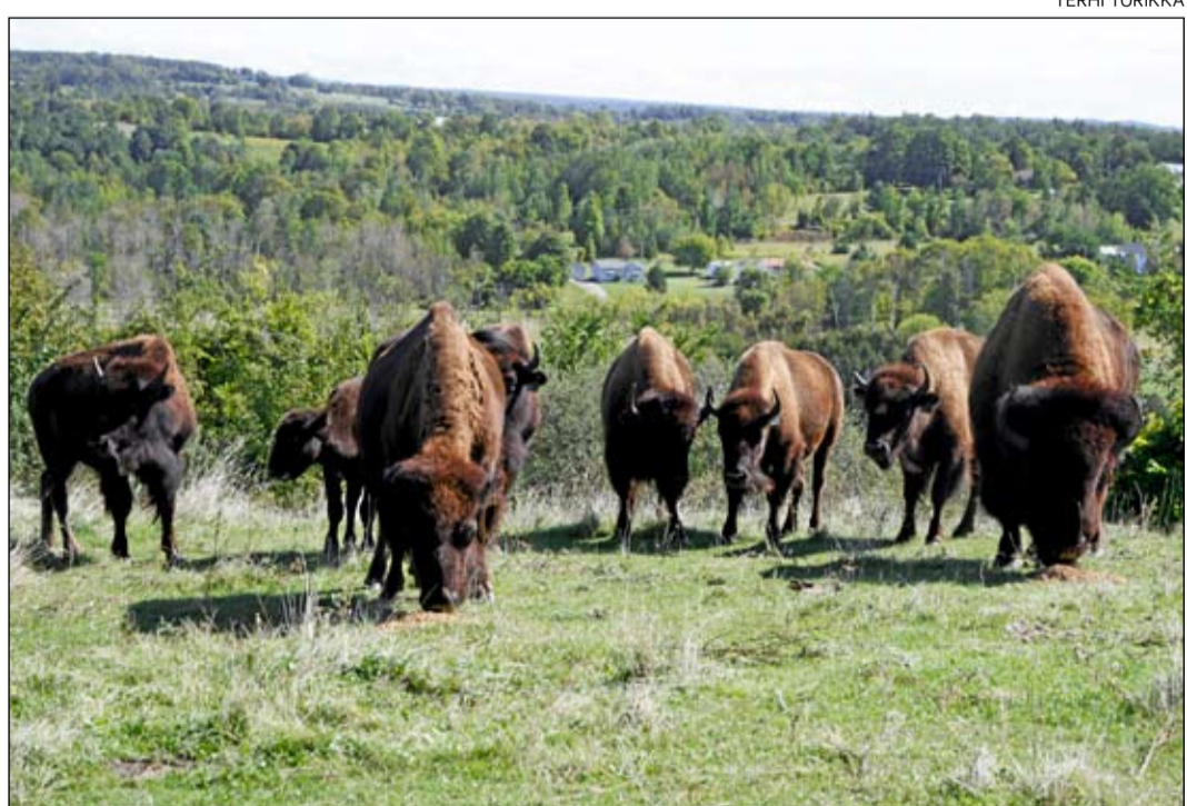
Century Game Parkin biisonit laiduntavat upeissa maisemissa, joita myös turistit pääsevät lava-autokyydillä ihaillemaan.

Myyös lammastaloudella olisi Kanadassa huimasti tilaa kasvaa, sillä lampaanlihan kysyntä on reippaassa nousussa ja kotimai-