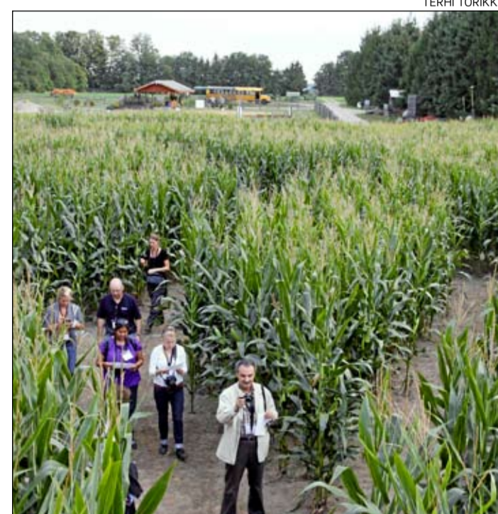
Noin 2,5 metriä korkeiden maissitähkän lomassa kulkeville poluille voi helposti eksyä ilman karttaa.

vastaan myös koululaisryhmiä, jotka Stromin mukaan jaksavat yllättävän hyvin kuunnella kierroksen ohessa pidettäviä tietoiskuja maissin ja kurpitsan tuotannosta.